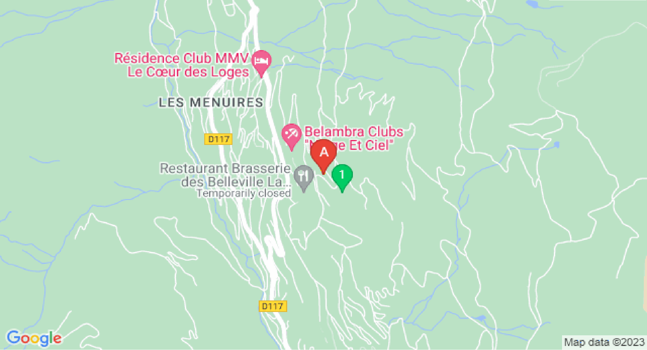
Map data ©2023